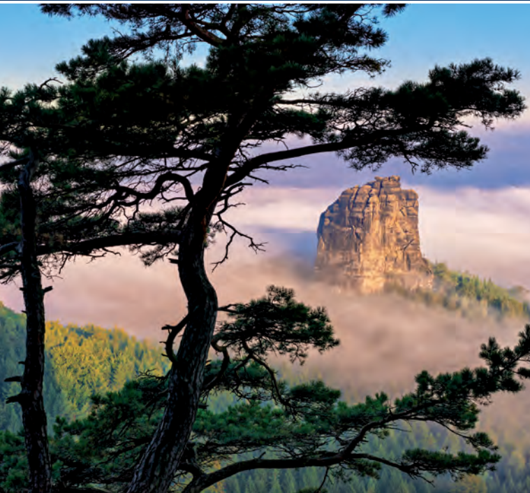
Schirmherr: Stanislaw Tillich, Ministerpräsident des Freistaates Sachsen