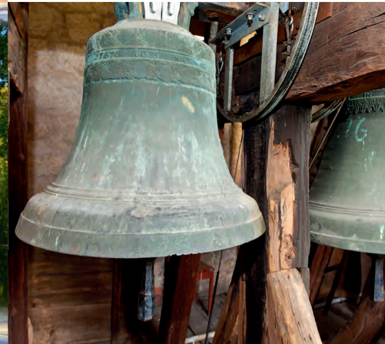
Schirmherr: Stanislaw Tillich, Ministerpräsident des Freistaates Sachsen